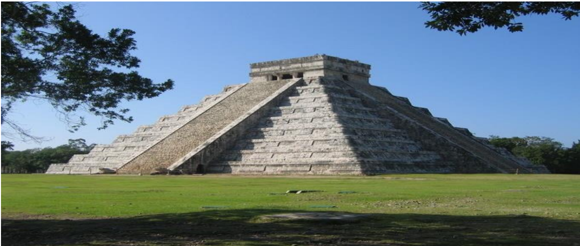
Exemplo de pirâmide maia, em Chichén Itzá, México

Como eram excelentes astrônomos, criaram calendários onde podiam conhecer as datas dos eclipses e estações do ano. Tudo isso era fundamental para a realização das atividades agrícolas e dos rituais aos seus deuses.